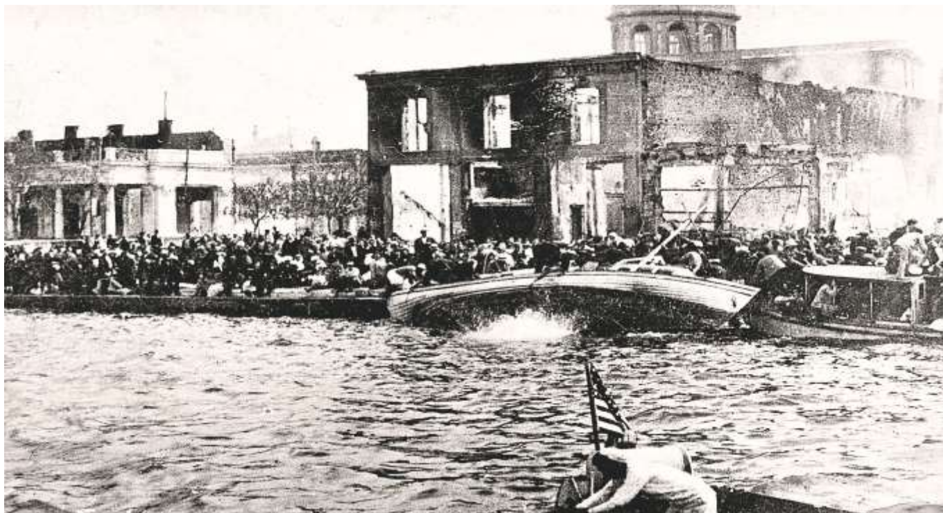
Η καταστροφή της Σμύρνης.