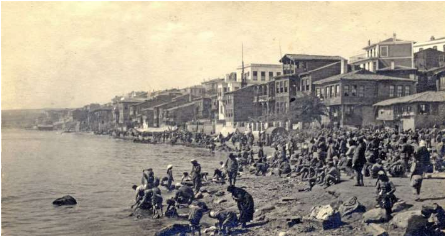
Οι πρόσφυγες της καταστροφής.