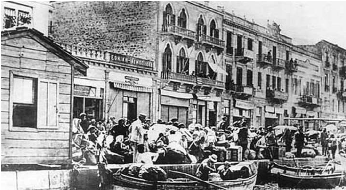
Οι πρόσφυγες προσπαθούν να σωθούν.