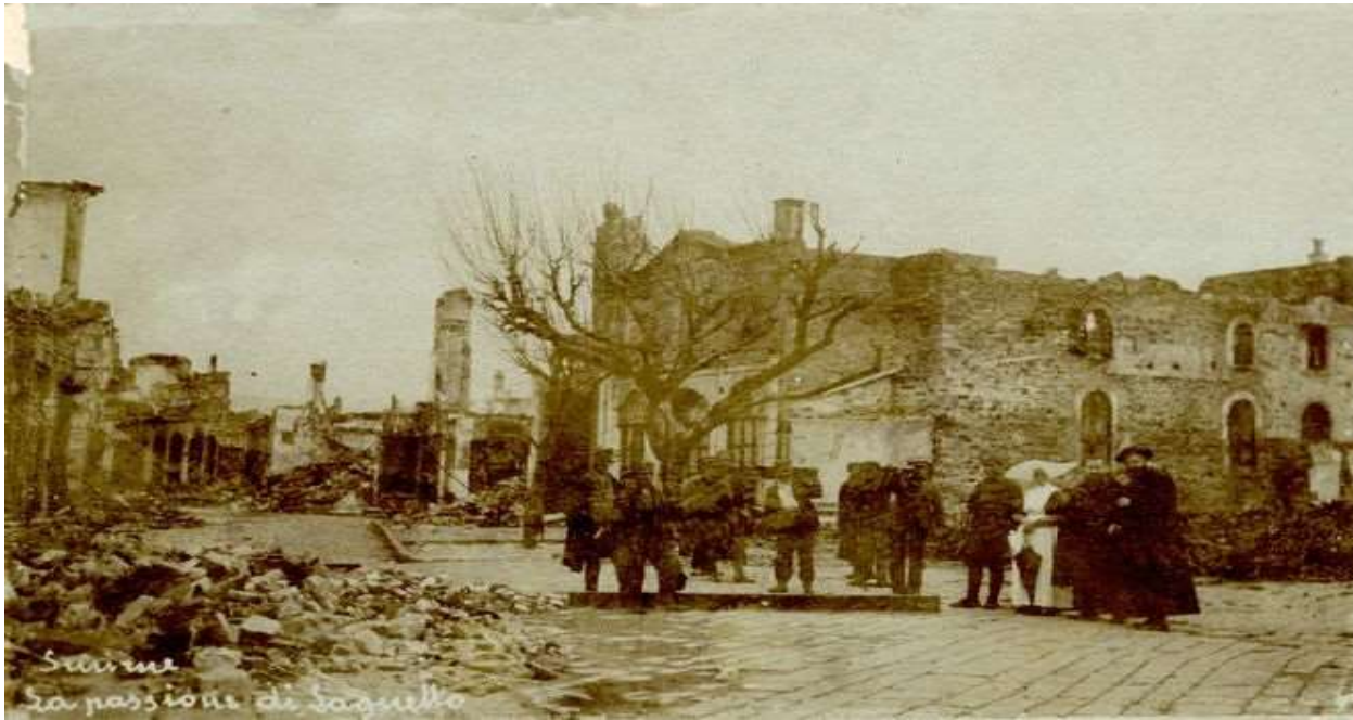
Η καμένη Σμύρνη.