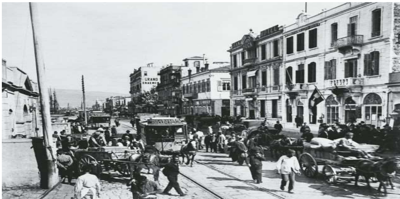
Μια καθημερινή μέρα στην Σμύρνη.