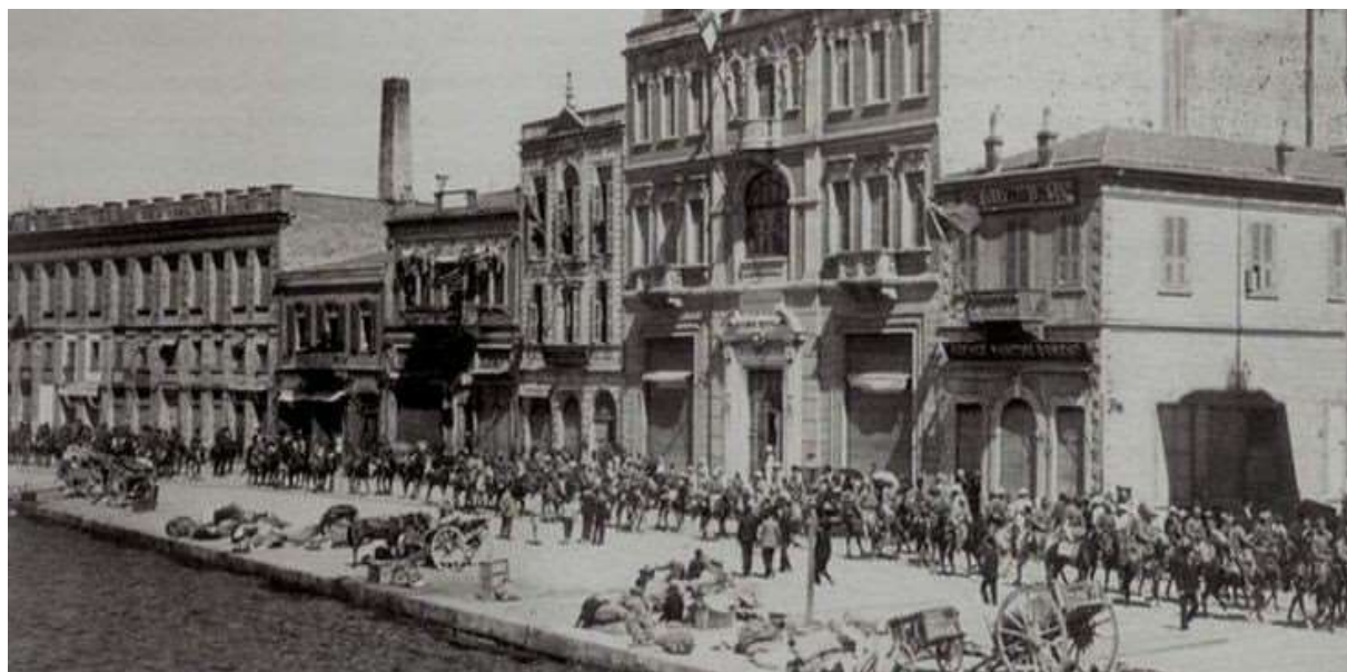
Το λιμάνι της Σμύρνης.