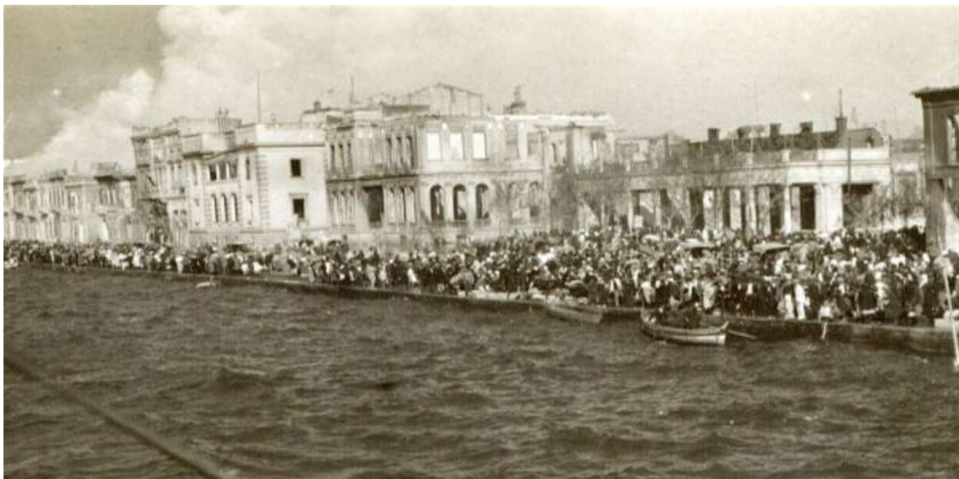
Η Σμύρνη καίγεται.