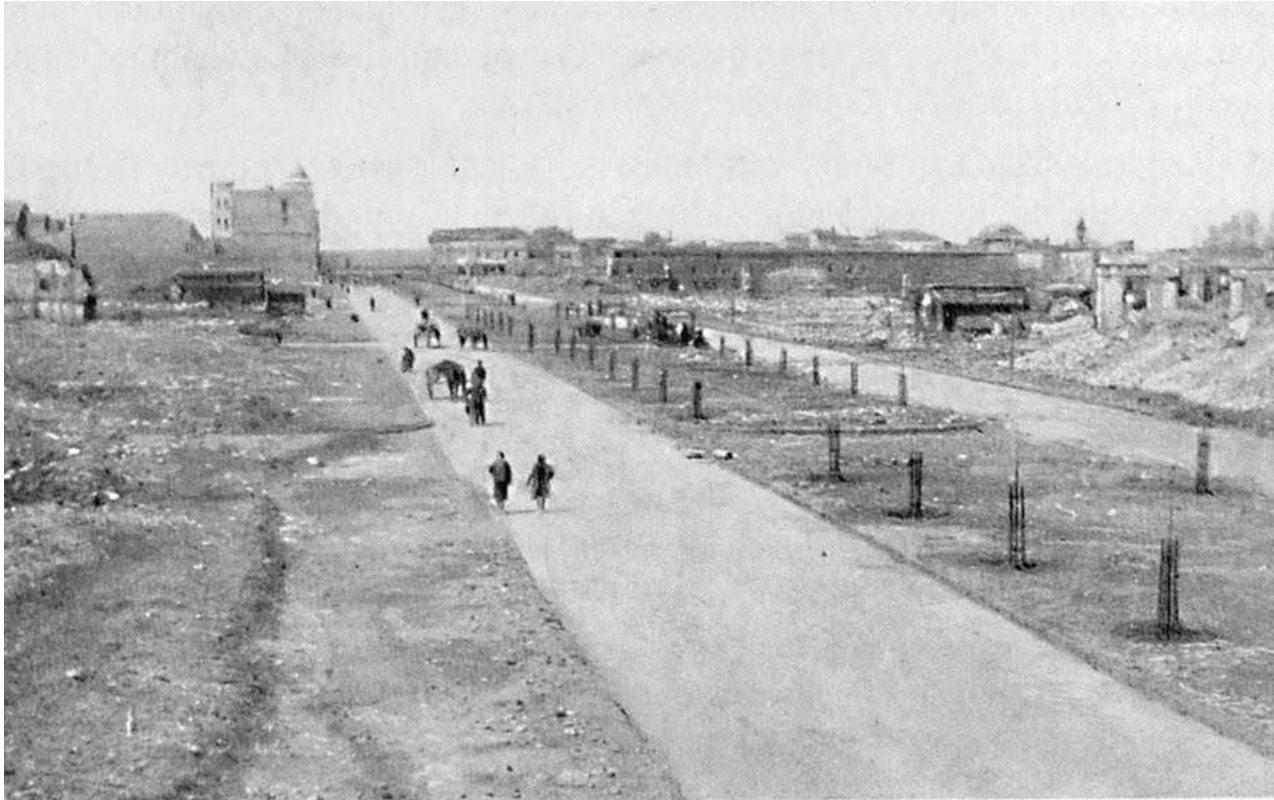
Η Σμύρνη μετά από λίγα χρόνια.