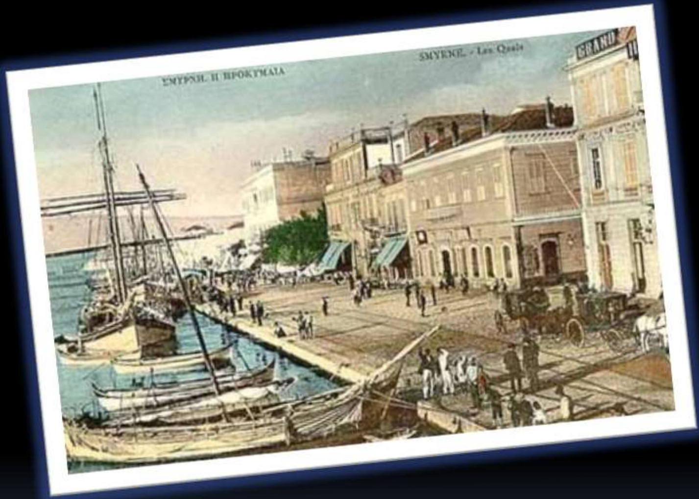
Η Προκυμαία Της Σμύρνης Πριν Την Καταστροφή