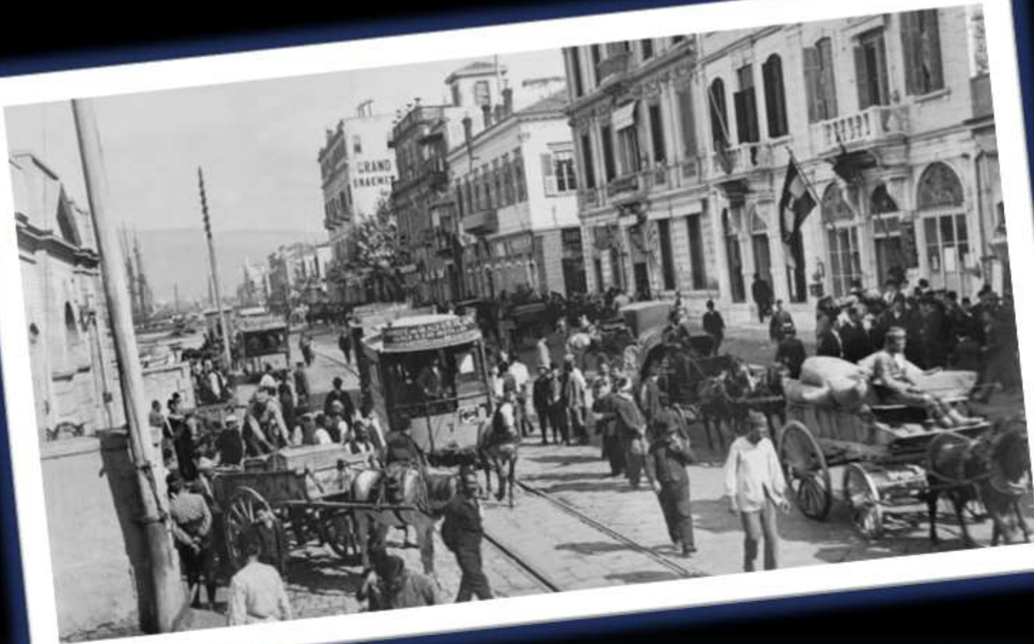
Σμύρνη, Μια Κοσμοπολίτικη Πόλη