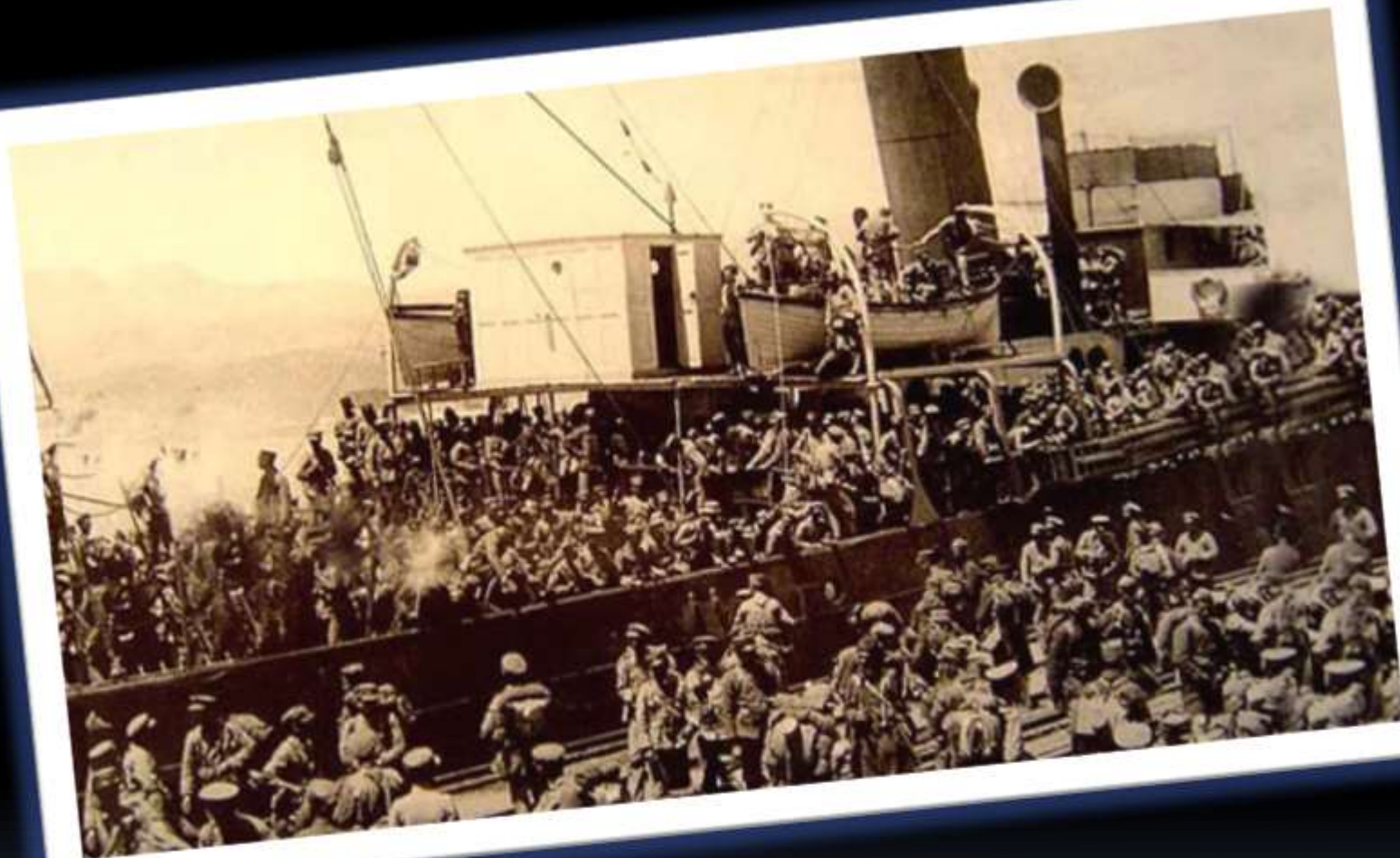
Η Απόβαση Στη Σμύρνη