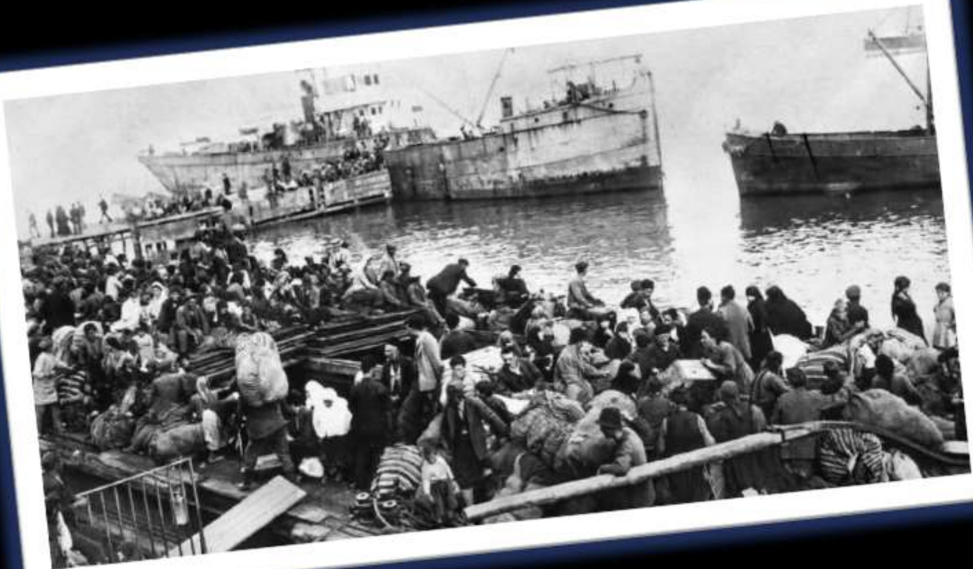
Η Αναγκαστική Φυγή Από Τη Σμύρνη