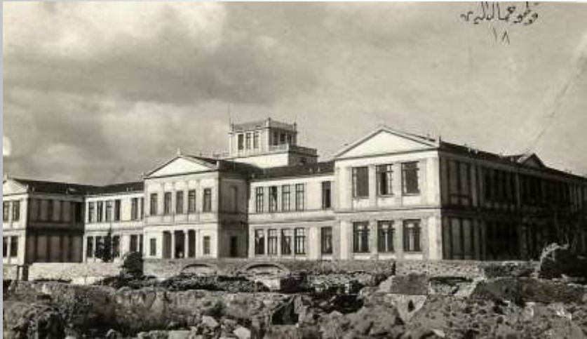
Η Ευαγγελική σχολή της Σμύρνης

Ας ρίξουμε μια ματιά και στα μεγάλα δημόσια κτίρια, σχολεία και πανεπιστήμια της πόλης.