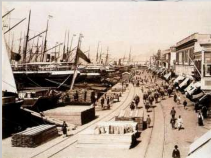
Ξένα πλοία καταφθάνουν στο λιμάνι

Άφιξη εμπορευμάτων στην πόλη, έπειτα από την καταστροφή της Σμύρνης