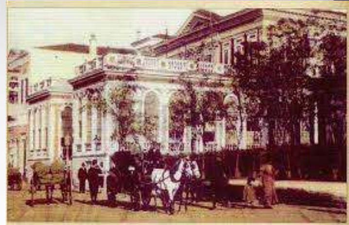
Μία από τις τότε λέσχες της Σμύρνης