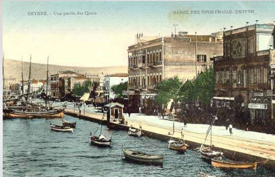
SMYRNE. - Une partie des Quais