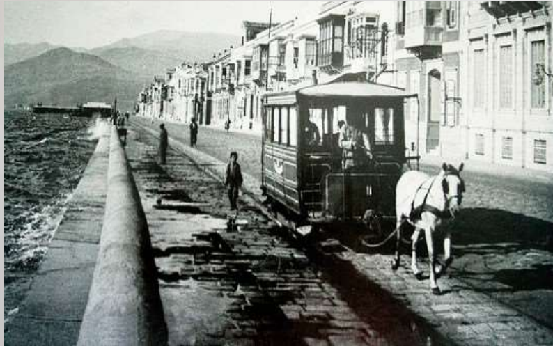
Η εικόνα της προκυμιάς της νεκρής πλέον Σμύρνης