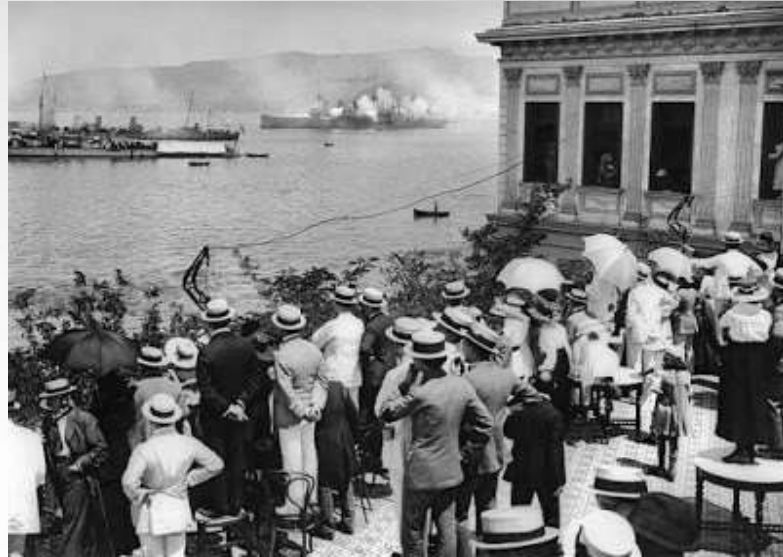
πλήθος ανθρώπων που ατενίζει το απέραντο πέλαγος

Η μουσική και τα τραγούδια ήταν πολύ έντονα στοιχεία σε καφενέδες, μπακαλοταβέρνες, γάμους και βαφτίσεις με τους οργανοπαίχτες να αποικαλούνται παιχνιδιάτορες και τα μουσικά όργανα, παιχνίδια. Στα μαγαζιά του Φραγκομαχαλά οι ντόπιοι έβρισκαν παιχνίδια όμορφα και κουρνιαστά, “από παραδείσια φτερά για τα μαλλιά των γυναικών μέχρι σιαρπίνια για Σταχτοπούτες”. Τα στοιχεία που αποδίδουν επαρκώς τον τρόπο ζωής των κατοίκων της Σύμρνης δεν μπορούν να είναι άλλα από βιωματικά.